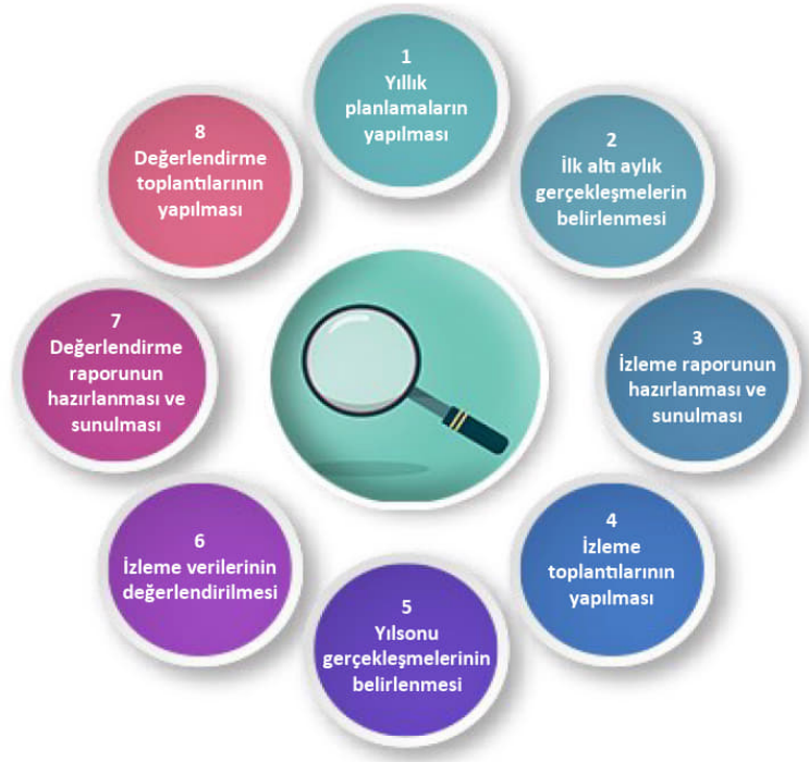
Şekil-4 İzleme ve Değerlendirme Süreci

İzleme ve değerlendirme sürecinin işleyişi ana hatları ile yukarıdaki şekilde özetlenmiştir.